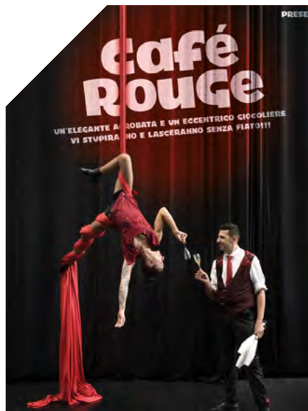
COMPAGNIA CIRCOBIPOLAR "CAFÉ ROUGE" Tessuti Aerei, Giocoleria, Scala d'equilibrio, Acrobatica di Coppia, Clownerie