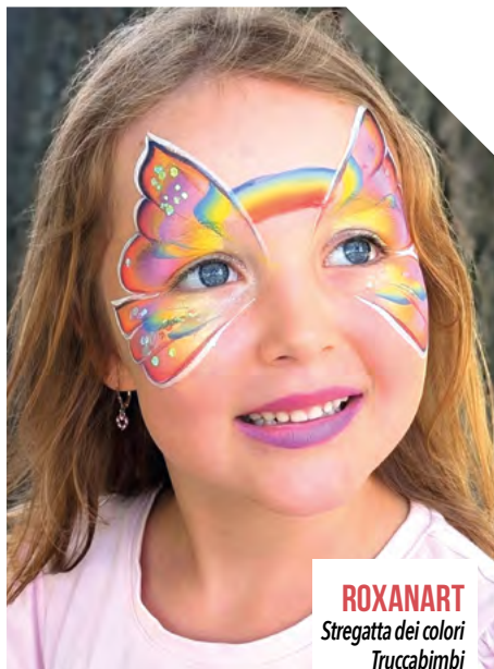
ROXANART Stregatta dei colori Truccabimbi